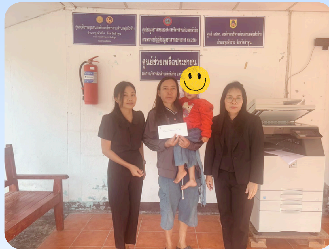
8. เด็กชายพร้อมภพ เมืองแก้ว ภาวะลำไส้อุดตัน การรักษา : รพ. เชียงใหม่ เงินช่วยเหลือ : 1,000 บาท