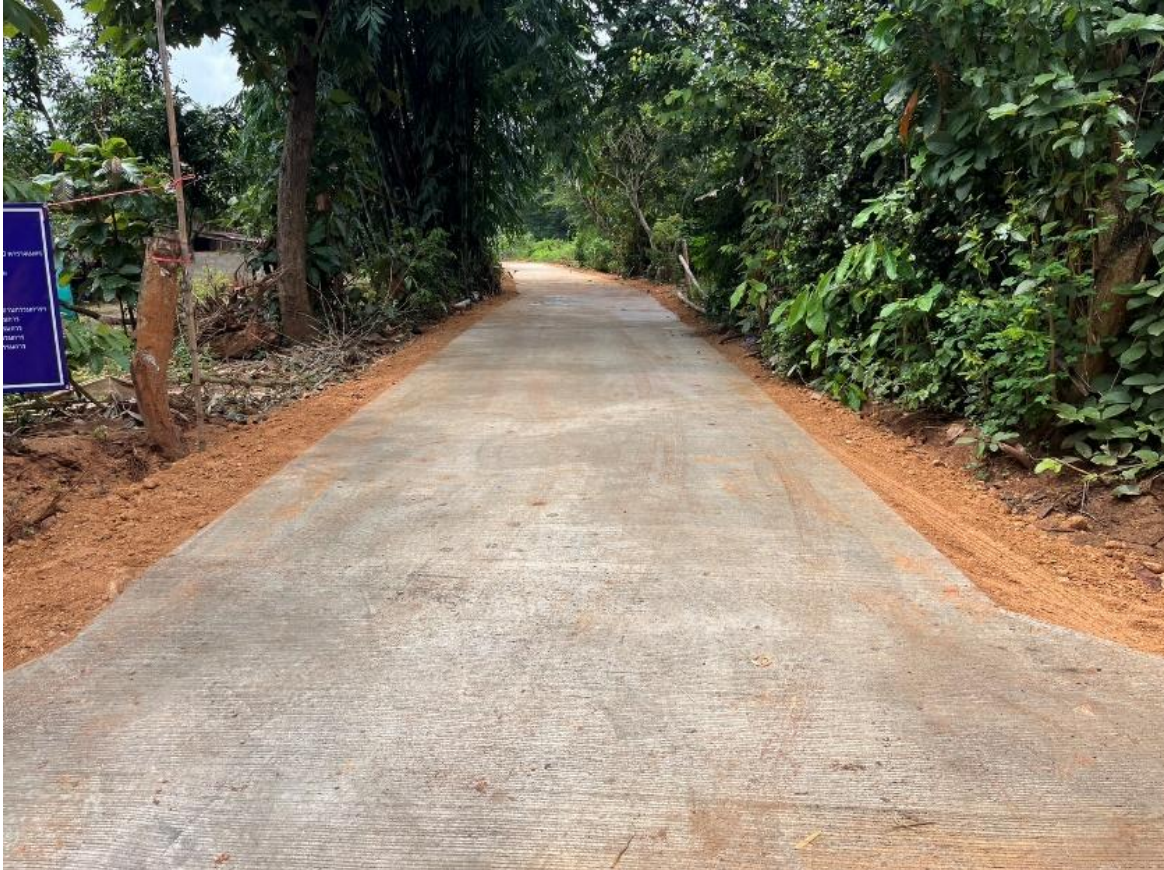
ป้ายโครงการ